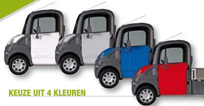
KEUZE UIT 4 KLEUREN